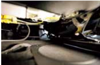
07 シート下の純正のシートが固定されている場所を利用して、シートカバーに装備されているフックを引っかけて固定。作業は08と09を参照。