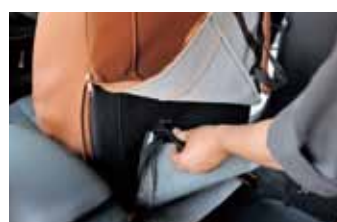
06 座面との隙間から引っ張り出した下部とファスナーで開いた上部を固定。この後にファスナーを閉じれば背もたれの作業は基本的に終了。