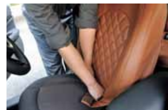
02 カバーを被せ終わったところで生地を座面との隙間に押し込む。柔軟素材&精緻な型取りがもたらすフィット性を実感する作業。