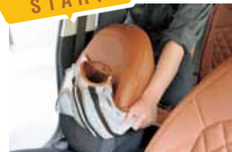
01 START まずはフロントシート背もたれから。ヘッドレストを外して対応するカバーを上からめくり上げた状態で左右均等に被せて行く。