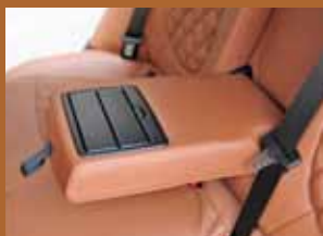
カバーでは対応が難しいリヤセンターアームレストも張り替え感覚は保たれる。当然ドリンクホルダー機能もそのまま。