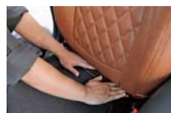
03 隙間にカバー下部をすべて押し込んだら調整作業へと移行。この時点でもパーフェクトなフィット性が得られていることわかるはず。

手順さえ追っていけばそれほど難しい作業ではない 極端に平たく言ってしまうと、装着はシートに被せて端部を固定し張り具合を調整するだけ。現車からキ