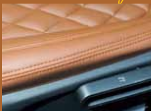
フチまでピシッと保たれた高度な縫製クオリティ。知らない人が見たら「張り替え？」と間違ってしまうも無理はない。