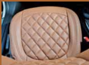
「ダイア」シリーズの特徴的なキルティング加工。左右対称に規則正しく入れられた美しい菱形デザインが大きなポイント。