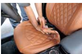
10 背もたれの後は座面。前方から後方に向かって包み込むように被せていく。この時、左右均等にゆっくりと被せて行く。