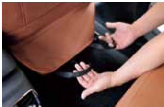
08 背もたれ装備されているゴム性の取り付けフック。07の純正取り付け位置に装着するためのもの。