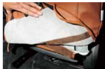
05 あらかじめ取り外しておいたシート背面のフラップをカバーの中に差し込む。フラップを戻さないで背面にシワが出てしまうので注意。