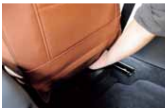
09 見ながら作業できない部分なので07の写真を参考に手探りでゴムをフックに引っかける。純正の位置が確認できれば簡単な作業。